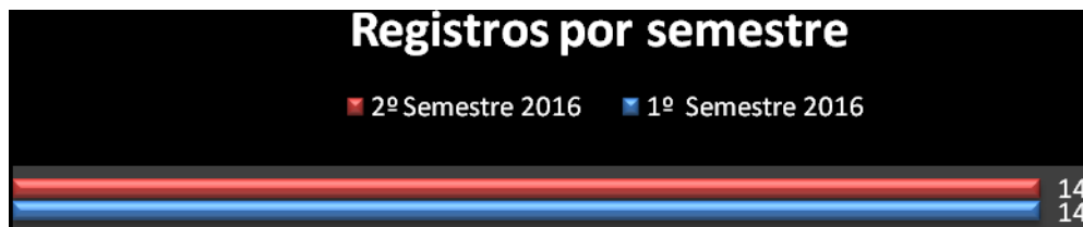
Gráfico 6.1 – Quantidade de Registros na Ouvidoria / Semestre

Conforme gráfico 6.1 abaixo, podemos observar que a instituição permaneceu com a mesma quantidade de demandas em relação ao primeiro semestre de 2016.