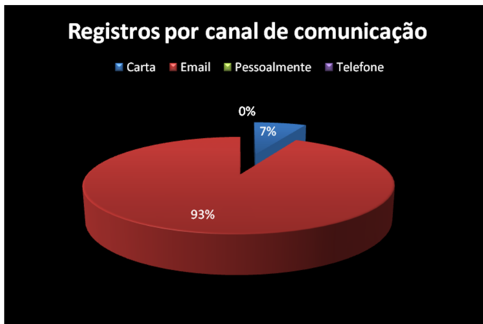
Gráfico 6.2 – Quantidade de Registros por canal de comunicação

Através do Gráfico 6.2, podemos observar que, durante o 2º semestre de 2016 não houve recebimento de demandas via telefone e, nos dois semestres de 2016 o recebimento de demandas via email representou 93%.