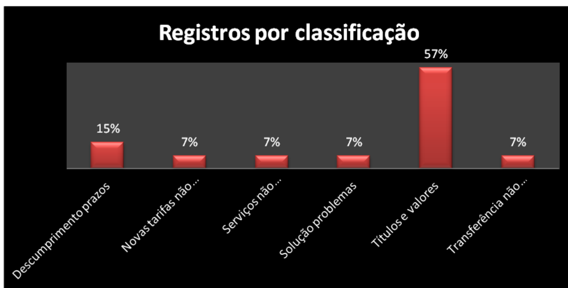
Gráfico 6.4 – Percentual de registros por classificação

O Gráfico a seguir demonstra o percentual de classificação mensal das demandas geradas através da Ouvidoria.