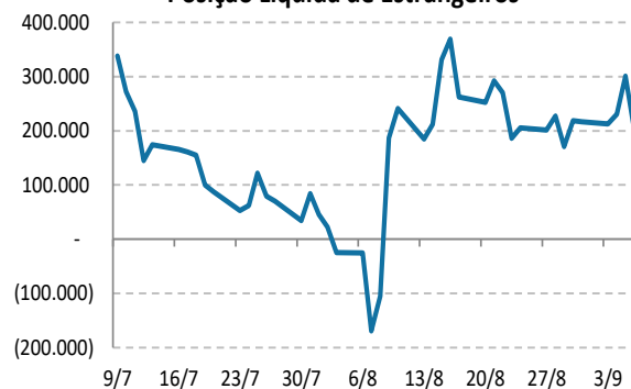
Contratos Futuros de Taxa de Juros Posição Líquida de Estrangeiros